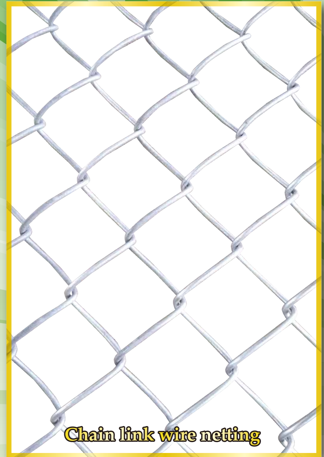
Chain link wire netting